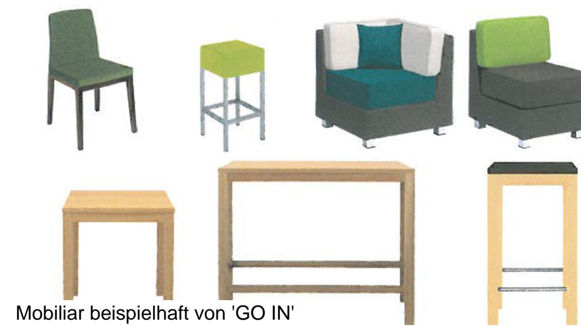
Mobilier beispielhaft von 'GO IN'